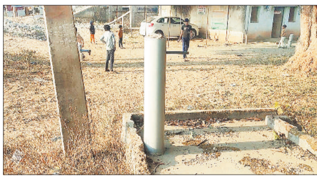
शो पीस बना नल कनेक्शन।