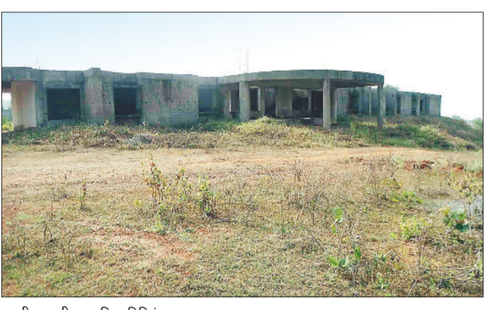
अधी-अधुरी एकडमिक बिल्डिंग।

सालों की मशक्कत के बाद शासन ने संत गिरि गुरु विवि को शैक्षिक गतिविधियों में विस्तार के लिए 25 नए विषयों की कक्षाएं प्रारंभ करने की अनुमति दे दी है लेकिन भवन के अभाव में विवि प्रबंधन के लिए शैक्षणिक विभागों का विस्तार किसी चुनौती से कम नहीं है। वर्ष 2008 में तत्कालीन सरगुजा विवि की स्थापना होने के बाद प्रबंधन द्वारा वर्ष 2008 में शैक्षणिक विभागों का संचालन प्रारंभ किया गया था। गुरुघासी दास विवि द्वारा शैक्षणिक विभाग अंतर्गत संचालित फार्मसी विभाग के साथ ही प्रयोजन मूलक हिन्दी, लॉ, फार्म एण्ड फेरिस्ट्री, कम्प्यूटर साइंस, बायोटेक्नॉलाजी पर्यावरण आदि विभागों का संचालन प्रारंभ किया गया। तब भवन के नाम पर विवि के पास प्रशासनिक कार्यालय संचालन के लिए मात्र एक पुराना शासकीय भवन उपलब्ध था। यूटीडी के विभागों के लिए प्रतीक्षा बस स्टैण्ड के पास निर्मित शासकीय कन्या हायर सेकेण्डरी स्कूल मणिपुर का भवन उपलब्ध कराया गया। इसके पूर्व भवन के अभाव में कई बार विभागों का संचालन अलग-अलग शासकीय भवनों में भी किया गया। यूटीडी के वर्तमान भवन में पर्याप्त जगह नहीं होने के कारण कक्षाओं के संचालन में अन्याय